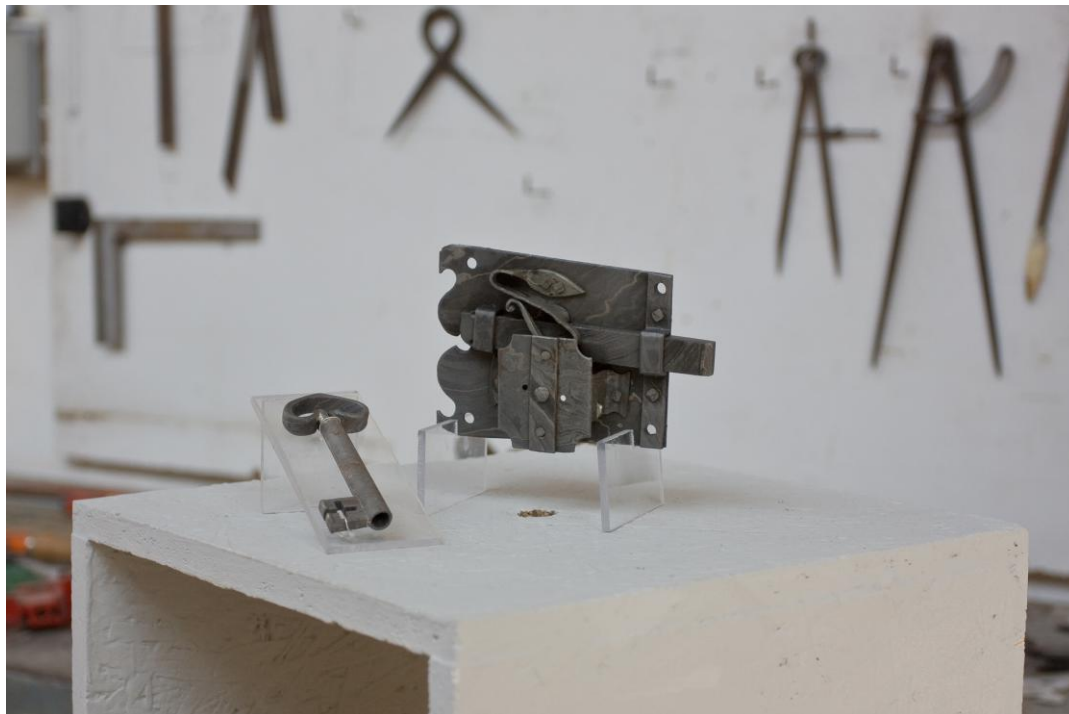
Riproduzione di chiave e serratura in damasco del XVII secolo

Alcuni esempi delle nostre realizzazioni: