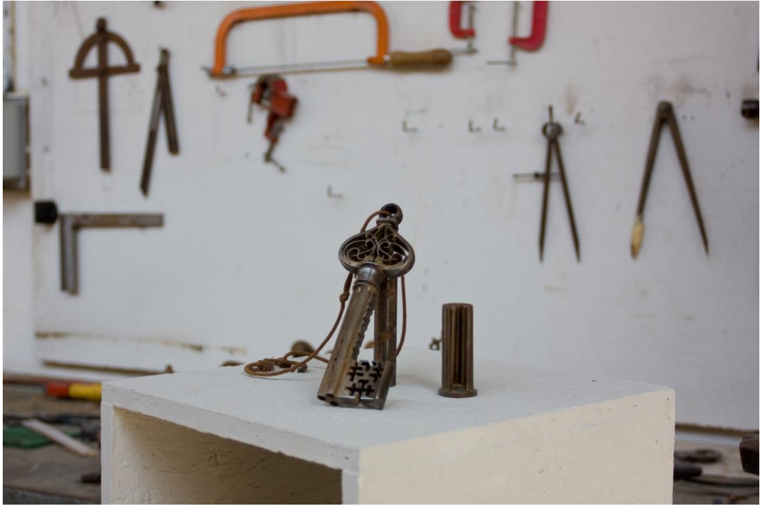
Riproduzione di chiave veneziana da forziere del XV secolo