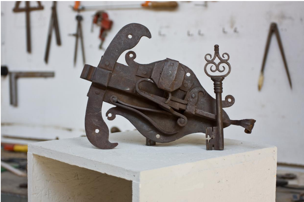
Riproduzione di chiave e serratura trentina "a balestra" del XVII secolo

(Alcune delle immagini precedenti riguardano una iniziativa con le collezioni comunali di Bologna. Le riproduzioni sono state esposte al museo Davia Bargellini e sono repliche di oggetti conservati in quella sede. Altri manufatti sono stati esposti a Castel Roncolo di Bolzano).